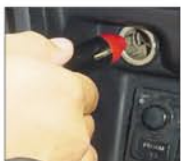
Adaptador para Auto

MALETÍN DE ALUMINIO. Facilita su traslado. Con el maletín de aluminio puede llevar la báscula a donde lo requiera sin riesgos de causar algún daño durante el traslado.