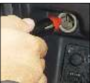
Adaptador para conectar la báscula al encendedor de automóvil.

La báscula L-EQ cuenta con una batería de respaldo, recargable, con una duración de hasta 100 horas de trabajo continuo, por 8 de recarga, de esta forma la báscula funciona en donde la requiera aún sin estar conectada al suministro eléctrico.